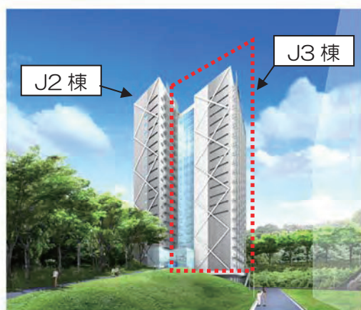
イメージ図（外観透視図）